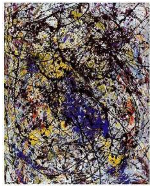
Reflet de la grande ours, 1947, Jackson Pollock