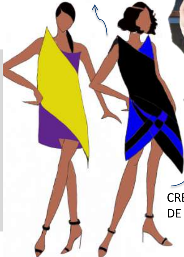
CRÉATIONS DE LILIANA