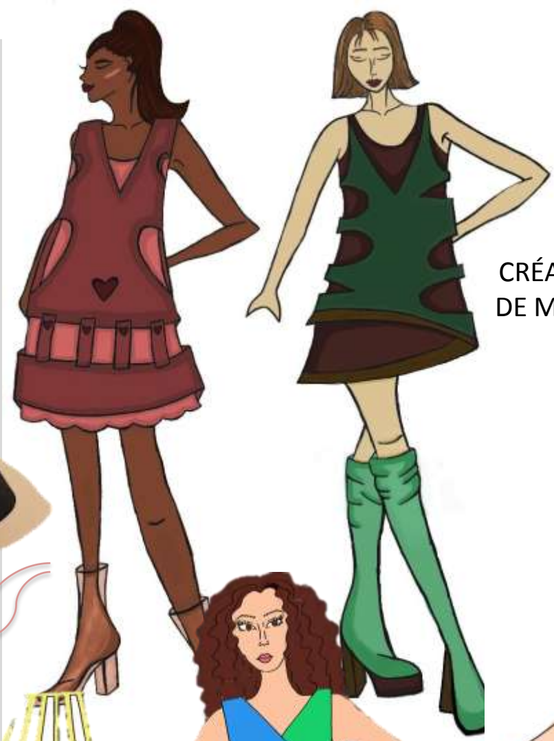
CRÉATIONS DE MANON