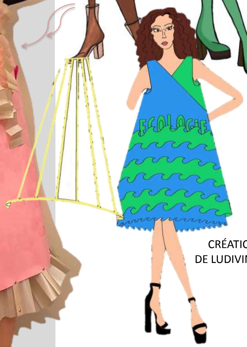
CRÉATION DE LUDIVINE