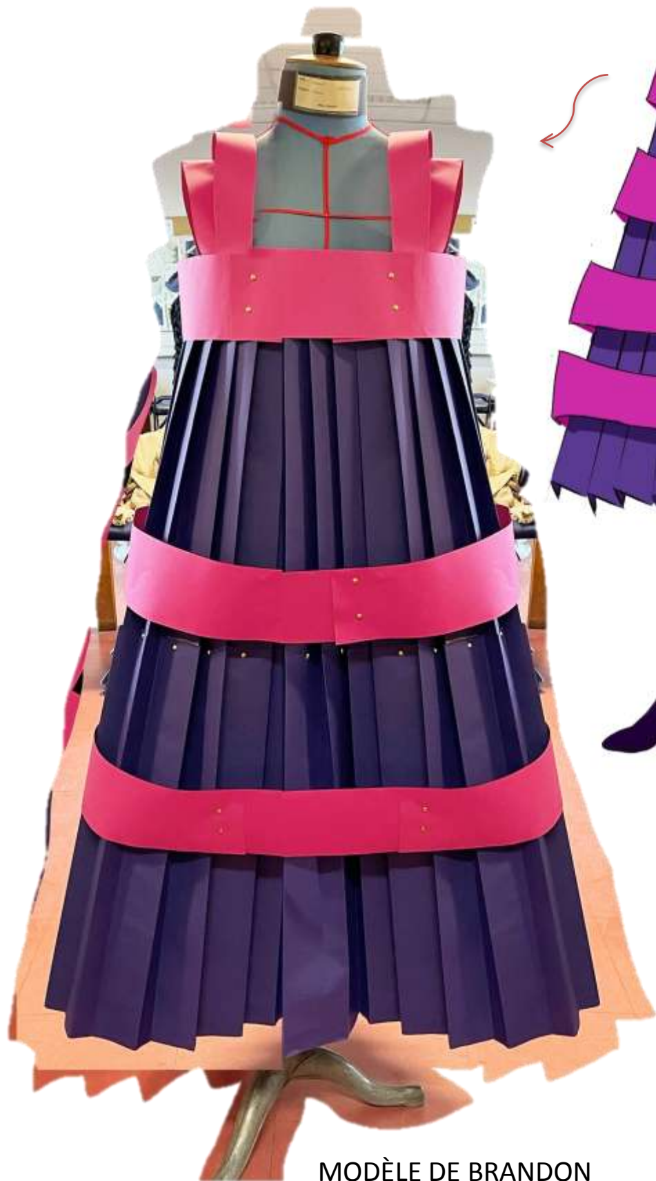
MODÈLE DE BRANDON